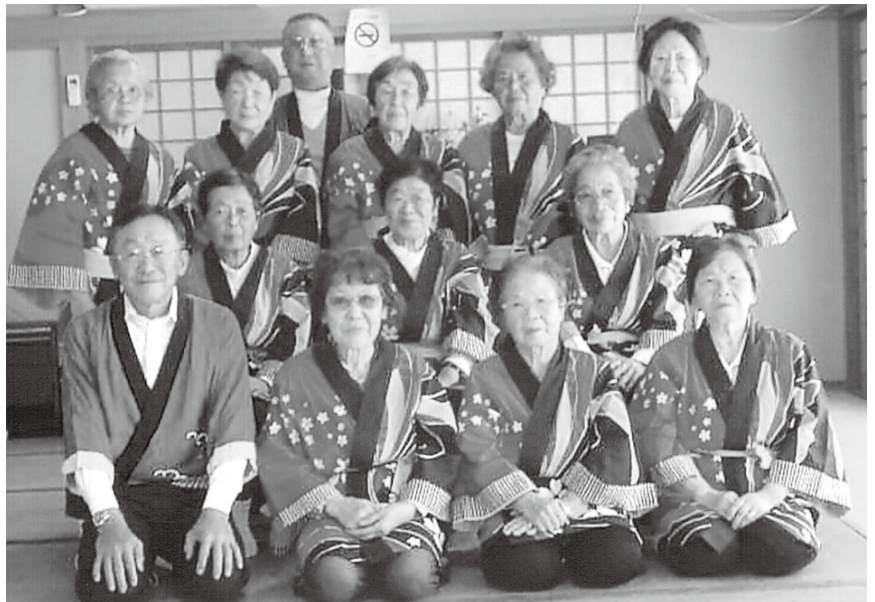
金子地区 踊り部メンバー

また、今年は新型コロナウイルスの関係で市老連の諸行事・金子長寿連の諸行事がやむを得ず中止・自粛という事態になり、日頃の活動の成果を発揮・発表する場がなくなってしまい、とても残念でした。しかし、来年こそは、新型コロナウイルス感染症が収束し、従来どおり、各種行事ができますようお願い、これからも練習に励み、発表会が部員全員でできる日を楽しみにしている毎日です。