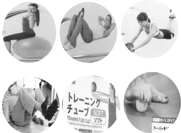
利用している健康器具の一部

使った感想をアンケートでとり、より一層の楽しみと、健康増進に役立てていただく予定です。