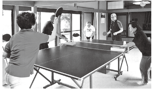
コロナに負けずにピンポン

「正しく恐れる。人間は孤立しては生きられない。常にコミュニケーションをし、笑顔で前向きに取り組むことで体内免疫力が付いて強い体力が養われる」を思いつつ週1回のペースで健康増進に励んでいます。