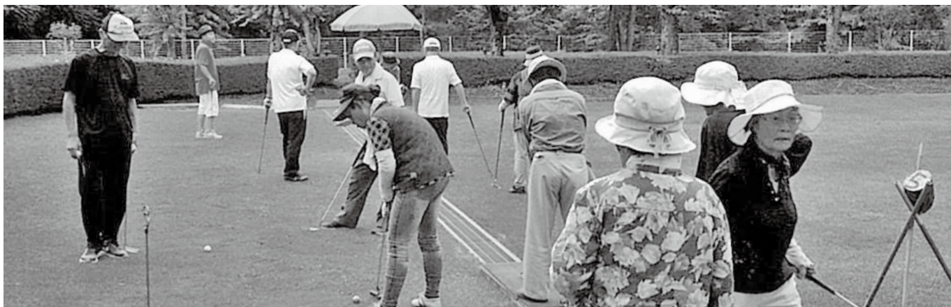
金子地区 パターゴルフ大会

2021年には東京オリンピック開催予定もあり世界各国の大勢の方々が見える中、新型ワクチンの摂取が一日でも早く可能になりますことを願いつつ、2021年に希望を抱いて、進んで行きたいと思っております。