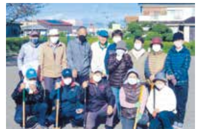
グラウンドゴルフ仲間が集合

り」等を教えながら、童心にかえり一緒に楽しんでいます。しかし、今年度は「コロナ」の影響ですべての行事が中止となりました。私たちも活動を自粛する毎日、とても残念でした。一日も早く以前のように、活動ができることを祈る毎日です。これからも、笑顔で元気に、地域の皆様と仲良く交流できる会でありたいと願っています。