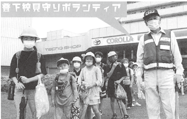
子どもたちから元気をたくさんもらっています

今回のコロナの特異性（無症状、潜伏期間）から常に感染しているかもしれないという前提の基に行動し、お互いに注意すること。