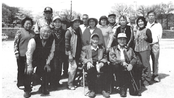
春の日帰りバス旅行で記念撮影

春の日帰りバス旅行ではフレンドシップ吉見に出掛け、グラウンドゴルフに懇親会と楽しい1日を満喫しました。