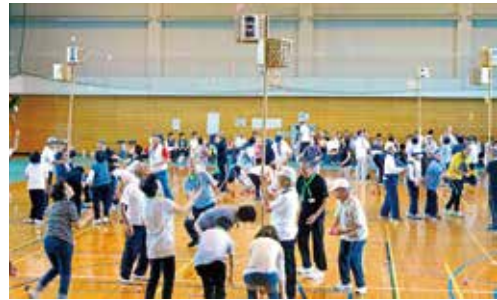
スポーツ大会の白熱した「玉入れ」

大きな行事です。宮寺地区体育館を会場にして約400名の会員が集い6種目の競技に汗を流します。その外には年4回のグラウンドゴルフ大会を、また年度末(3月)には親睦バス旅行をと、高齢化が進む中で会員の交流と絆を深める活動を行っています。孤立化が進む時代の流れの中で会員同士の交流をどう図るかが大きな課題です。