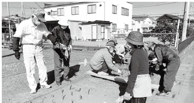
春には美しく咲くことでしょう

その後、苦土石灰を撒き、スコップで耕しました。15cmほどの間隔に小枝をさして植え付け場所を決めました。そこに移植ゴテで球根の3倍ほどの