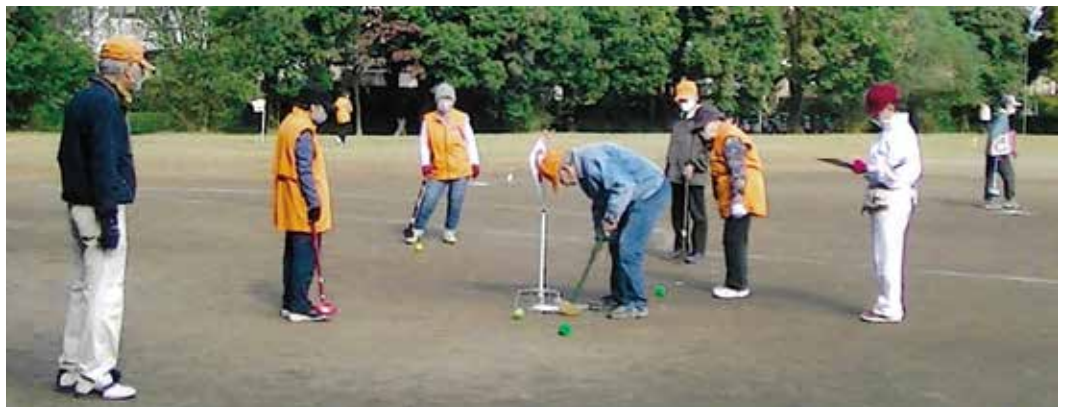
扇・東地区 グランドゴルフ大会

市当局のご理解、ご指導を得ての大会でしたが、事故もなく参加者全員がリフレッシュできた有意義な大会となったことを喜んでおります。