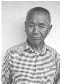
多くの書物を読破してきました

子どもの頃から本を読むことが好きでした。数々のジャンルの中から市老連だよりへの寄稿ということで「老いの福袋」(樋口恵子著)という本を選びました。今の日本は高齢者オリンピックがあったとしたら堂々の金メダル65歳以上の割合が