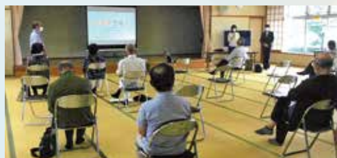
会報紙制作についての説明会が行われました