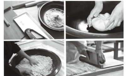
自分で打つそば、最高！

われています。そば粉などの素材の新鮮さもそうですが、あらゆる工程において鮮度が重要とのことであり、自分で打つそばに勝るものはないと思います。今日に至っています。そば打ちは、集会所にて年3~4回13名