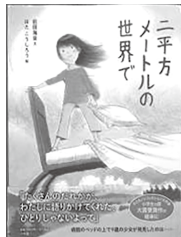
多くのことを考えさせられる名作です