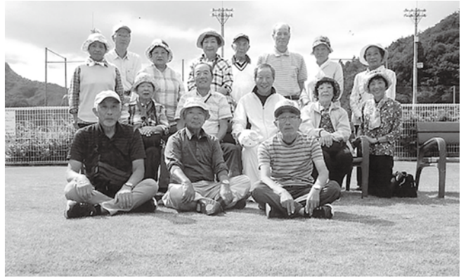
いつもの仲間と笑顔でパチリ!

あっという間に一カ月、一年が過ぎ去っていくのも、仲間と健康で毎日を過ごしているからだ感謝しています。