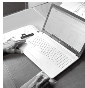
私の愛用パソコンです

がすすめばすべて良しという考え方ですので、パソコンに限らず、かえで会の活動のグラウンドゴルフ、パターゴルフ、カラオケ等すべて中途半端です。