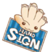
道路横断時の安全行動 イメージキャラクター 「サインちゃん」