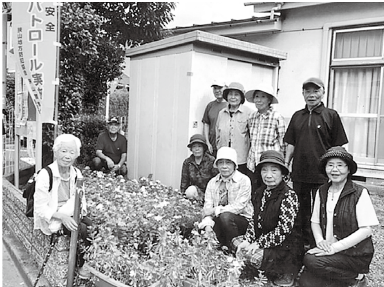
活動すべてが素敵な時間

具体的には、4月総会、6月春の旅（日帰り）、9月御食事会、11月秋の旅（一泊）、1月新年会、老連。グラウンドゴルフ大会、スポーツ交流と大会、芸能発表会、あじさい大学入学、健康体操と講話、カラオケ、踊り、世代間交流（保育園児とふれあい）、社会奉仕（武蔵藤沢駅草刈りとゴミ拾い）花いっぱい運動（八区公会堂と下山公園）と掃除をする、などです。