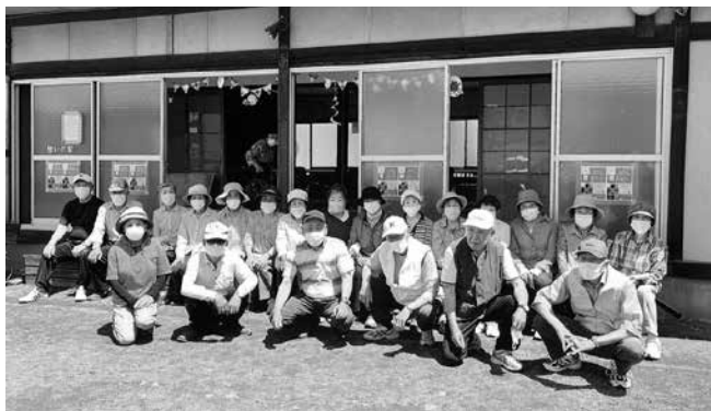
皆と過ごす日々が人生最高のご褒美

南の小高い山に沿って西武鉄道が走り北側には入間川、緑に囲まれ住めば都の50数年、地域との交流も拡がり7年前から老人会の活動に参加して楽しんでいます。家から徒歩10分、明寿会憩いの家が会員の集う場所です。コロナ禍で室内での活動や親睦旅行は中止となり、グラウンドゴルフのみが会員の親睦を深める唯一の活動になっています。会員は50名、週2回の練習日には20数名の参加で賑わいます。