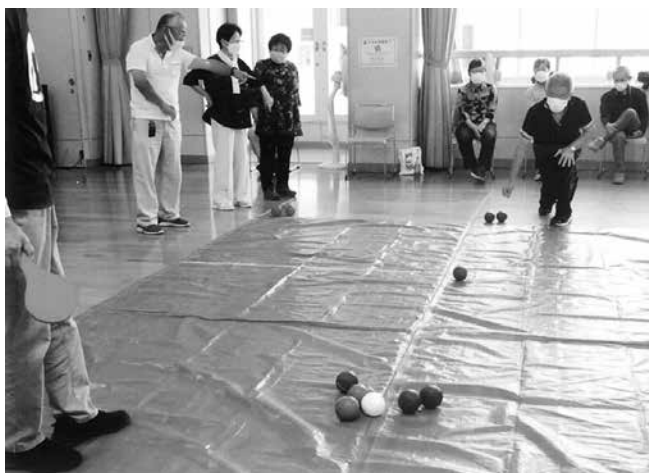
指導を受けながら実際に投げます

一日も早く会員の皆さんにご披露して、明るく健康な毎日を過ごしていただけるように願っています。