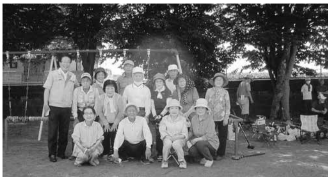
定期的にグラウンドゴルフ練習中

そして一日も早くマスクを外して笑顔が見える平穏な日々が戻りますように願っています。