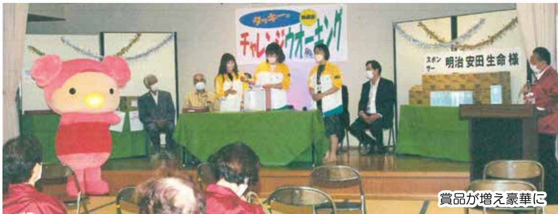
賞品が増え豪華に