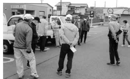
生活環境の保全に向けて活動

資源回収は、平成28年より、みつば会(第3区老人会)の事業の一環として資源の有効活用を目的にスタートいたしました。