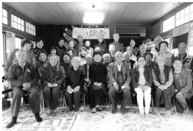
とっても仲よし長生会メンバーです

全国的に会員の減少が問題となっているようですが、東部長生会は毎年のように会員が増加して盛り上がっています。役員やスタッフの方々の熱意と工夫のお陰と、心から感謝しています。