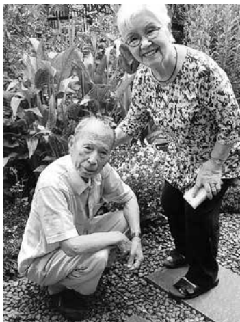
お互い助け合って2人で200歳へ

2人が出逢い結婚して73年。ともに90歳を過ぎ2人で186歳。幸いなことに2人とも杖にも頼らず好きなことに没頭でき、本当に幸せなことだと思えます。