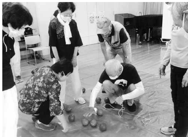
どちらのチームが近いかな