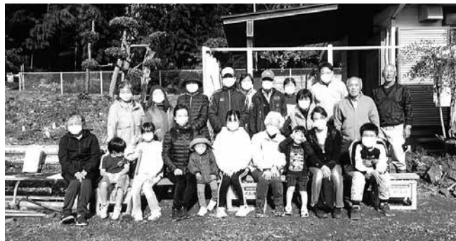
未来に繋げて三世代交流

根岸長寿会は現在会員 33 名ですが、1/3 は入院中であつたり家から外に出られないような人で、実際に動ける人は約半数です。金子地区の中にあつて、いちばん小さい根岸地区だけが、保育所、小、中学校と、東金子地区にある学校に通学するようになって、すでに 40 年以上が経過しました。