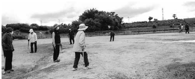
自然に囲まれてひろびろと

私自身は、グラウンドゴルフの練習と雨の日以外はほとんど畑に行き年間 20 種類ぐらいの野菜を作っています。雑草に追いかけるながら、がんばっています。